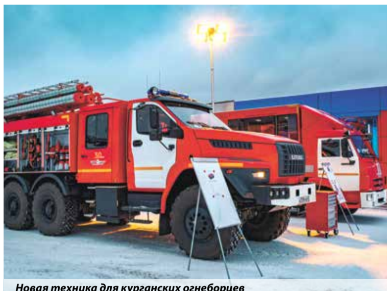
Новая техника для курганских огнеборцев

В этот же день состоялась церемония вручения ключей от новой пожарной техники, поставленной в СУ № 16 ФПС МЧС России согласно плану распределения по специаль-