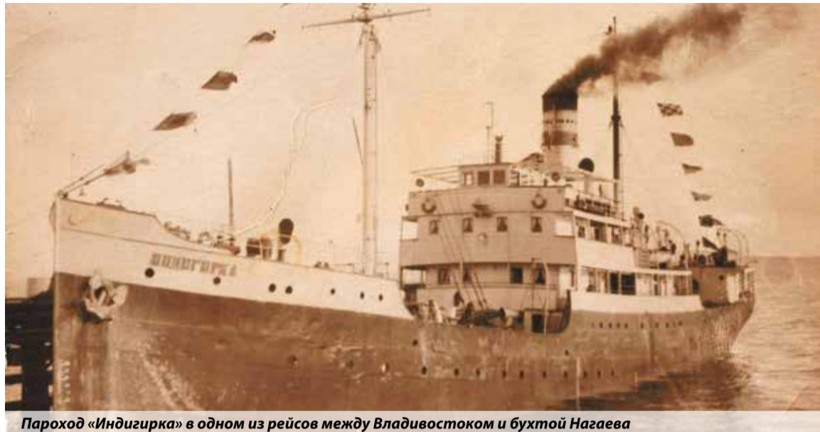
Пароход «Индибирка» в одном из рейсов между Владивостоком и бухтой Нагаева

Поэтому неудивительно, что в последнем рейсе навигации, в который «Индибирка» отправилась 8 декабря 1939 года, на любые ограничения наплевали откровенно и демонстративно. На небольшой пароход, в принципе не предназначенный для перевозки людей, набили свыше тысячи человек. Из Нагаева