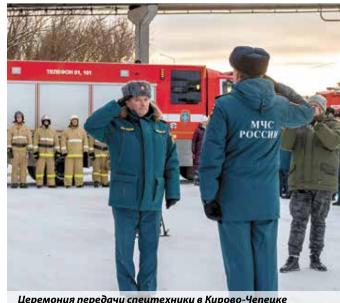
Церемония передачи спецтехники в Кирово-Чепецке

Виктор Жестков, по материалам региональных пресс-служб