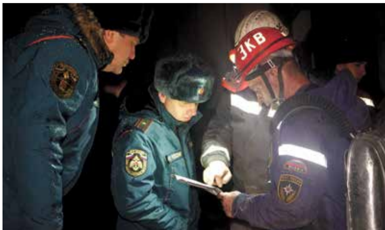
Спасательные работы на шахте начались практически сразу после взрыва

Одновременно разведка выработок проводилась силами 32 отделений ВГСЧ, обследовалось 34 км выработок. В ходе разведки обнаружено трое горнорабочих с признаками жизни. Они эвакуированы на поверхность и переданы медикам. 11 пострадавших обнаружены без признаков жизни, тела троих удалось поднять.