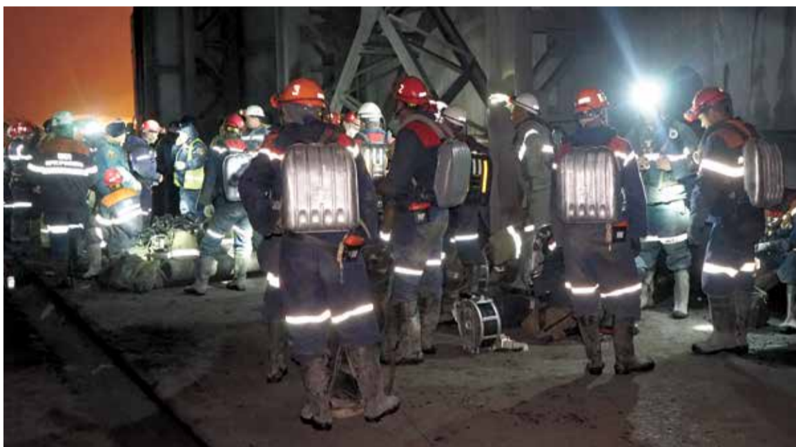
Всего к спасательным работам было привлечено почти триста человек

В связи с ухудшением обстановки в горной выработке на аварийном участке и возможностью возникновения повторных газодинамических явлений в 12.10 ведение аварийно-спасательных работ было приостановлено. Отделению ВГСЧ была дана команда выходить на поверхность.