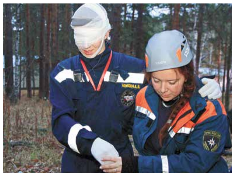
Девушки тренировались оказывать первую помощь пострадавшим и эвакуировать их из зоны ЧС