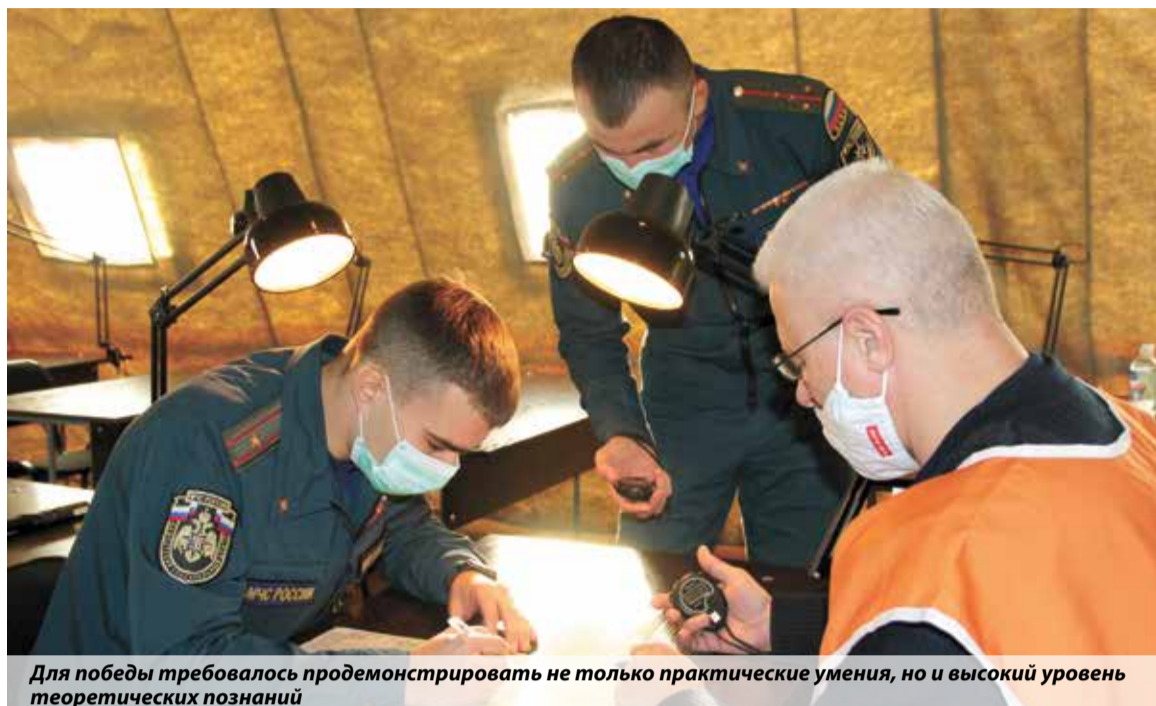
Для победы требовалось продемонстрировать не только практические умения, но и высокий уровень теоретических познаний

— Один из этапов соревнований — специальная подготовка. Во время нее курсанты сдают теоретическую и практическую части.