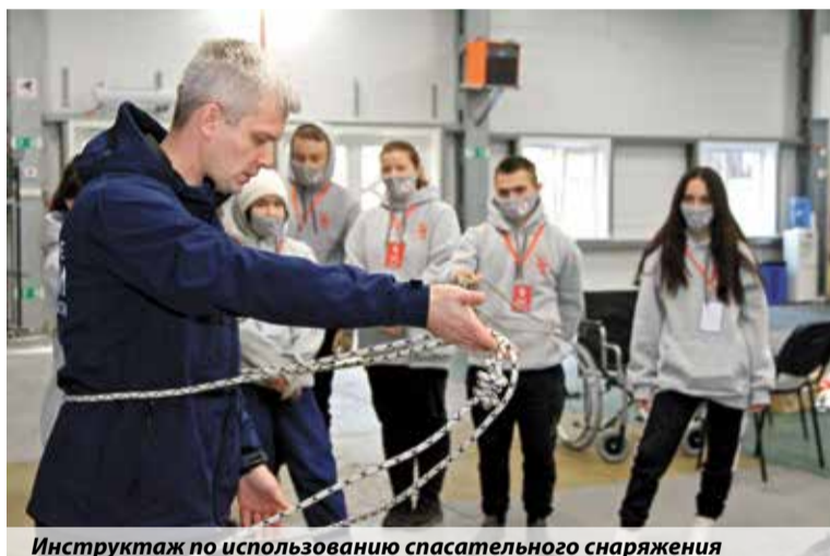
Инструктаж по использованию спасательного снаряжения

Анна Черникова, пресс-служба УРИ ГПС МЧС России