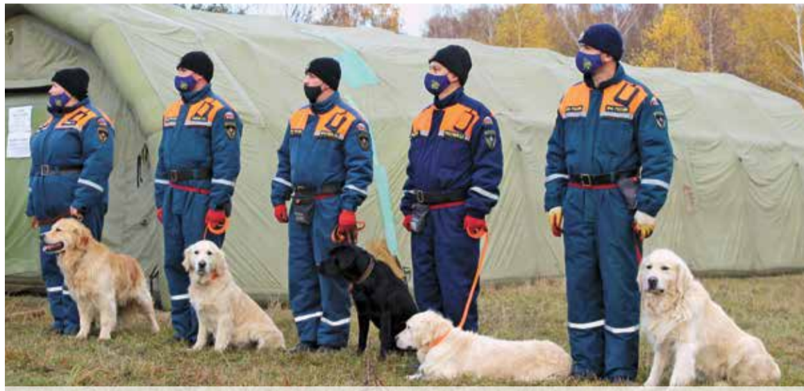
По результатам испытаний аттестацию прошел 21 кинологический расчет

В Туле прошла аттестация кинологических расчетов МЧС России. Какие испытания проходили собаки и их тренеры