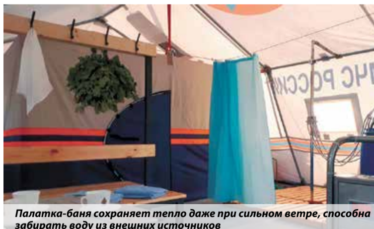
Палатка-баня сохраняет тепло даже при сильном ветре, способна забирать воду из внешних источников

Палатку дооснастили мобильной гидравлической станцией, с возможностью забора и подачи воды в душевую систему даже из внеш-