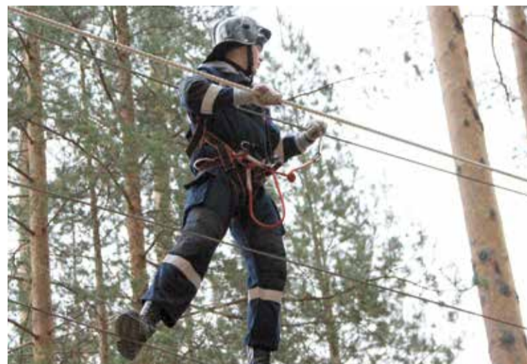
Практическая проверка полученных ранее теоретических познаний