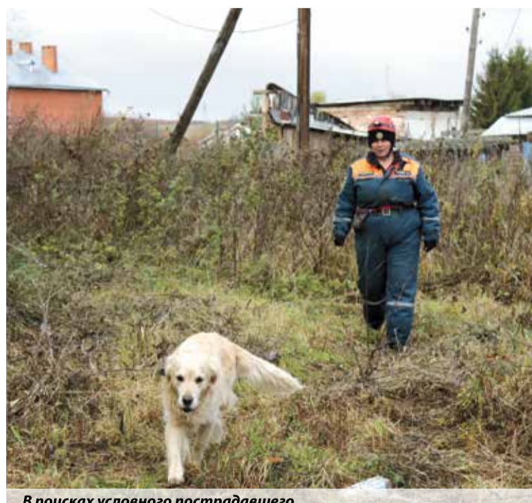
В поисках условного пострадавшего

Елена Коноплева, пресс-служба ГУ МЧС России по Тульской области