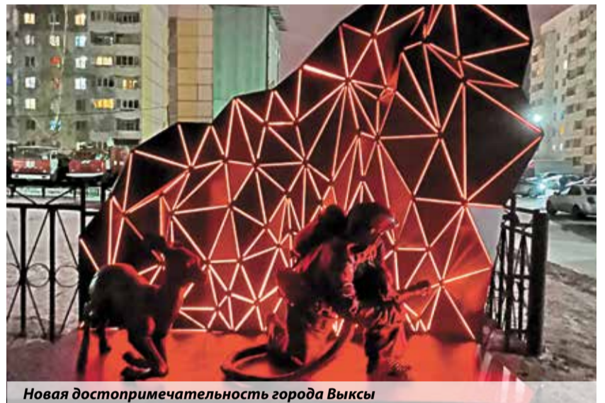
Новая достопримечательность города Выксы