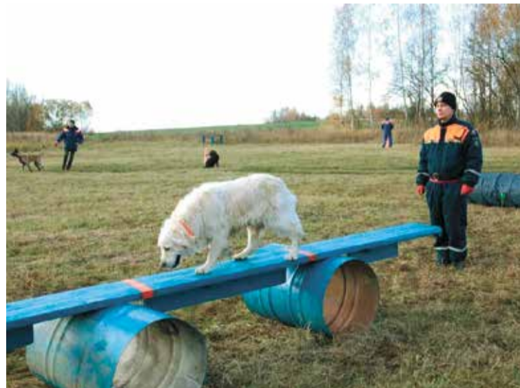
На полосе препятствий