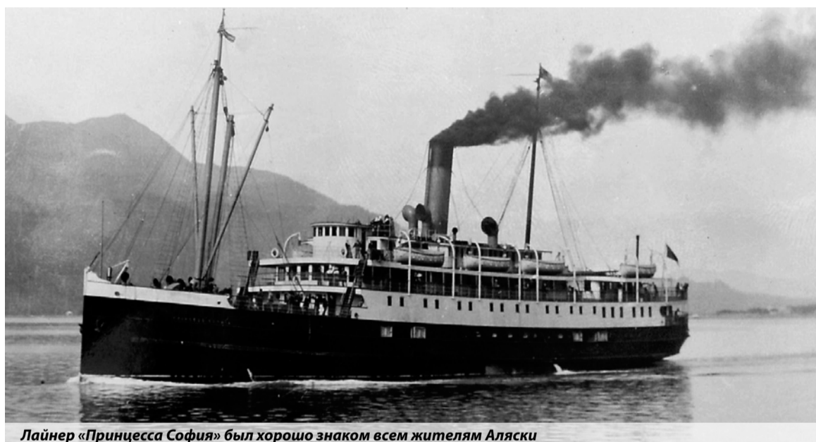
Лайнер «Принцесса София» был хорошо знаком всем жителям Аляски

давал гудки, и по времени, спустя которое доносилось эхо, определяли расстояние от берега. Разумеется, подобный метод не обеспечивал должной точности, и, по более поздним расчетам, лайнер отклонился от курса как минимум на одну морскую милю (1,852 км).