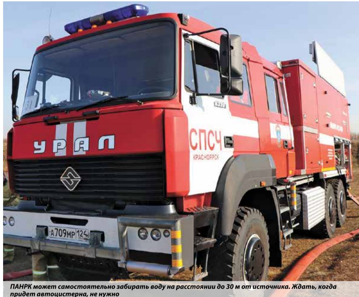
ПАНРК может самостоятельно забирать воду на расстоянии до 30 м от источника. Ждать, когда придет автоцистерна, не нужно

Екатерина Леонардова, пресс-служба ГУ МЧС России по Красноярскому краю